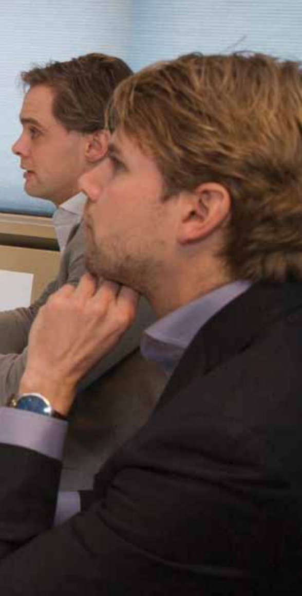
LOESJE PRAKTIJKEN FOTOGRAFIE